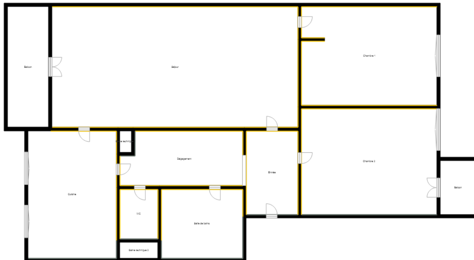
PLANCHE DE REPERAGE

Bien : 447LDA0402 - 465 16 RUE MARCEL RIVIERE 77400 LAGNY SUR MARNE